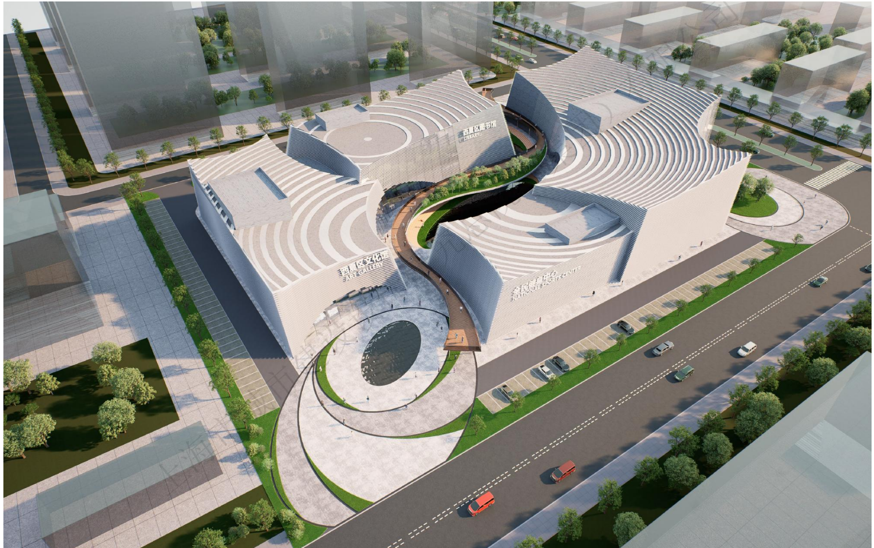
西夏区全民健身中心建设项目效果图