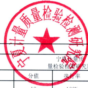
自治区项目支出绩效自评表 (2023年度)